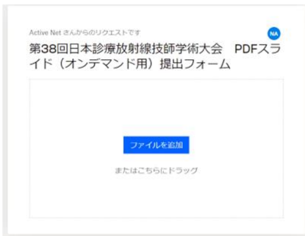
① ファイルを追加をクリック