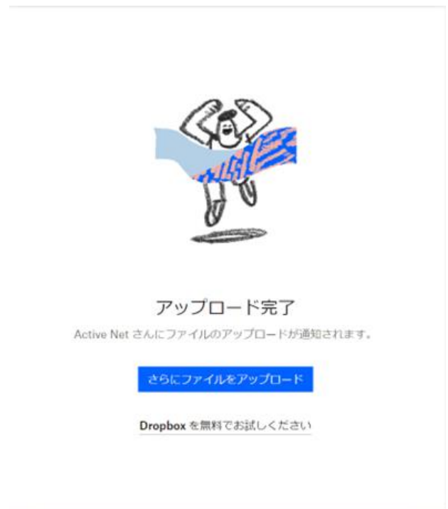
⑥アップロードの完了画面