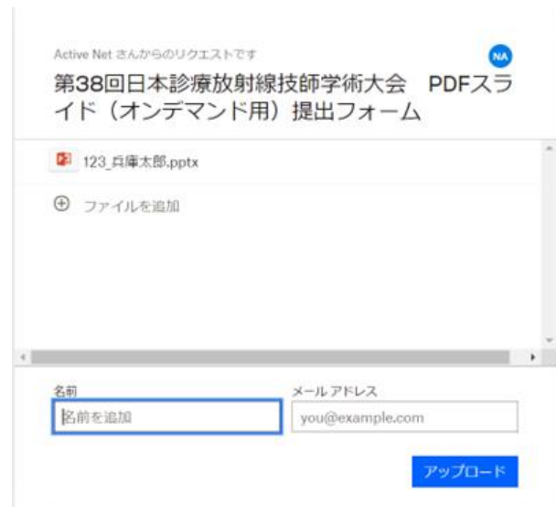
④ 名前とメールアドレスを入力