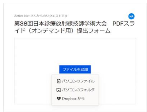
②アップロードするファイルの場所を選択